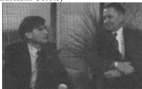
Стив Джобс и Росс Перо в момент обнародования информации об инвестициях техасского миллиардера в компанию NeXT