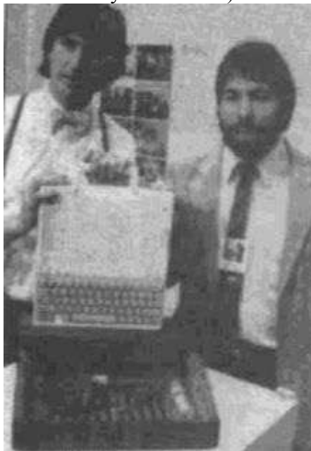
Стив Джобс и Стивен Возняк с компьютером Apple IIe на презентации в Сан-Франциско, весна 1984 г.