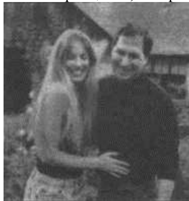
Стив Джобс и его жена Лорин во дворе своего дома в один из беззаботных моментов их жизни