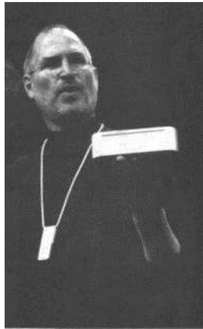
Стив Джобс представляет новый Mac Mini; на шее новый iPod Shuffle.

После доклада на конференции и выставке MacWorld, 11 января 2005 г.