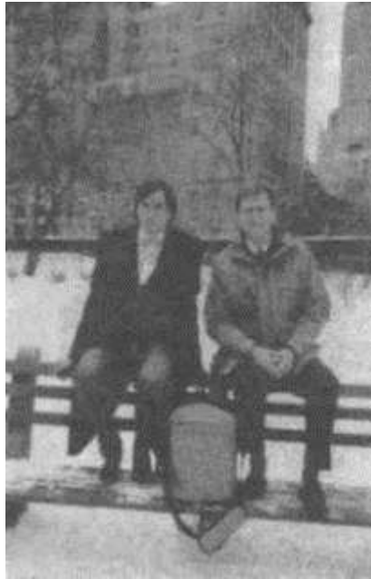
Стив Джобс и президент Apple Джон Скалли в Центральном парке на Манхэттене, через несколько дней после официального выхода компьютера Macintosh на рынок; в сумке – Macintosh, 30 января 1984 г.