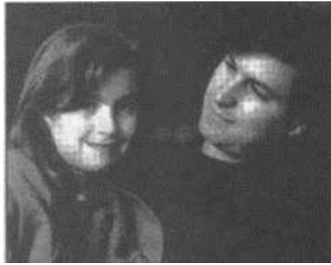
Стив Джобс с дочерью Лизой в бывшем главном офисе компании NeXT в Редвуд-Сити (штат Калифорния), февраль 1989 г.