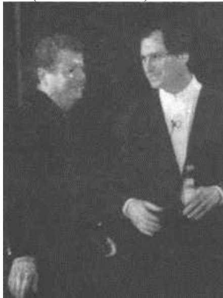
Председатель совета директоров Apple Computer Inc. Джил Амелио и бывший председатель Стив Джобс на выставке MacWorld в Сан-Франциско, январь 1997 г.