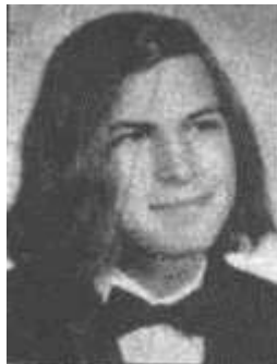
Стив Джобс, ученик выпускного класса Homestead High School