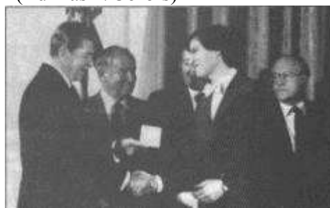
Стив Джобс получает награду «Благодарность Президента» от Рональда Рейгана в Белом доме, 19 февраля 1985 г.