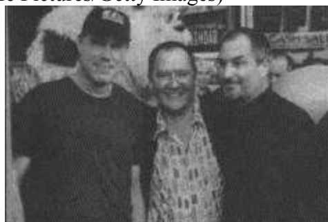
Председатель совета директоров компании Disney Майкл Айснер, Джон Лассетер из компании Pixar, продюсер и режиссер анимационного фильма «История игрушек», и Стив Джобс на премьере фильма «Корпорация монстров», снятого совместно компаниями Disney и Pixar,