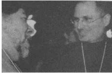
Стив Возняк и Стив Джобс на MacWorld Expo в Сан-Франциско, 11 января 2005 г. (Alan Luckow)