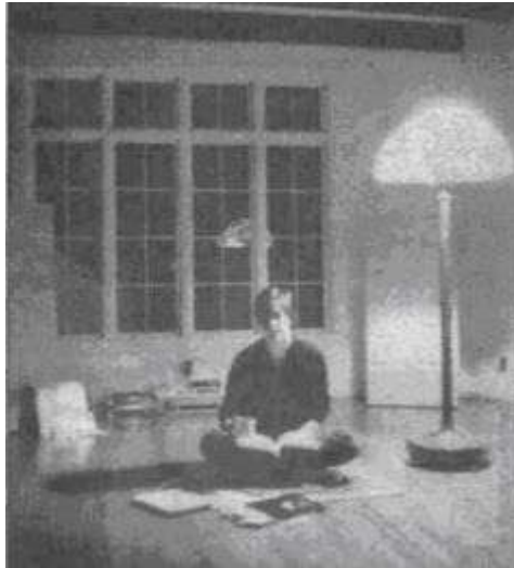
Стив Джобс в своем первом доме в Лос-Гатос (штат Калифорния), 15 декабря 1982 г.